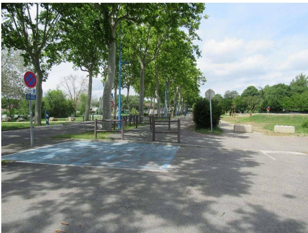
Parking PMR et cheminement